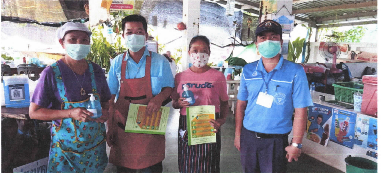
กิจกรรม การล้างตลาดสดเทศบาลตำบลบ่อพลอยตามหลักสุขาภิบาล อย่างน้อย ๑ ครั้ง